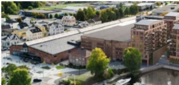
Foreslått løsning med tak over dagens takparkering

I forbindelse med utbyggingen mot elva, foreslås det at dagens takparkering i eksisterende parkeringshus kan overbygges med tak. Dagens fasade på parkeringshuset er tenkt oppgradert i forbindelse med tiltaket.