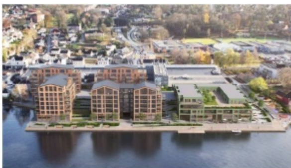
Illustrasjon som medfølger foreslått reguleringsendring

Gjeldende plan legger opp til utbygging av Down Town som krever ombygging av eksisterende bygningsmasse med rampe til tak, takparkering og boliger over eksisterende senter. Etter renoveringen av Down Town er dette ikke lenger aktuelt. Det foreslås å justere enkelte feltgrenser og byggehøyder slik at en utbygging som illustrert under til venstre kan gjennomføres. Det innebærer at den planlagte utbyggingen i hovedsak skjer over eksisterende parkeringsareal. Nytt hovedgrep legger til rette for å bryte opp bygningsvolumet mot Porsgrunnselva, i tillegg til at det åpnes for saltak, med hensikten å oppnå god tilpasning til eksisterende omkringliggende omgivelser.