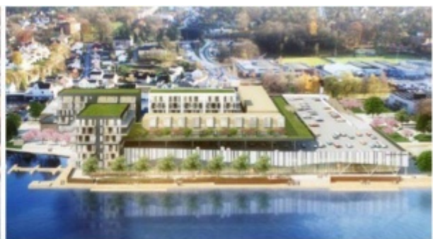
Illustrasjon fra gjeldende reguleringsplan