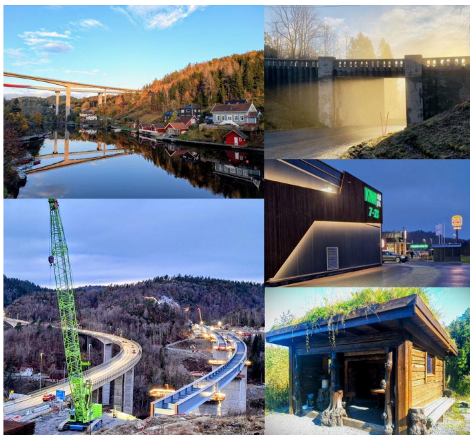
BILDER FRA DAGENS LANGANGEN.

Etter at skolen brant ned vinteren 1970, ble det bygd en ny skolebygning på Myrhaug øst for Torvet. Her vokste også Myrhaugfeltet fram og bygda opplevde en betydelig tilflytting av familier i etableringsfasen. Dette førte i løpet av få år til høye elevtall ved skolen og et blomstrende