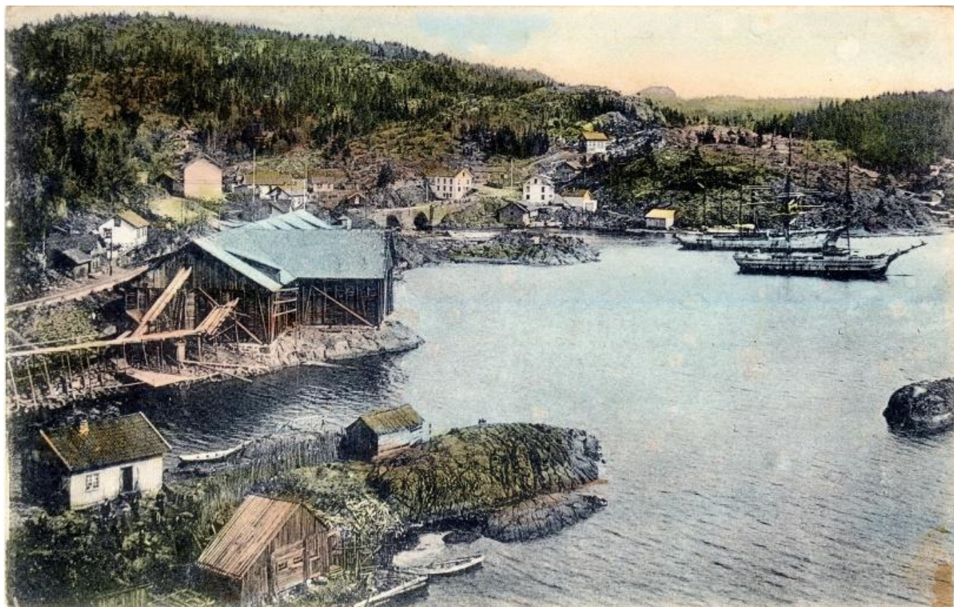
LANGANGEN PÅ BEGYNNELSEN AV 1900-TALLET. FOTOGRAF UKJENT.

Bildet ovenfor forteller at Langangen på begynnelsen av 1900-tallet var et sted med stor aktivitet på mange områder. På denne sida av brua ser vi Sundsåsen ishus, ovenfor dette skolen som ble bygd i 1874 og påbygd med en 2. etasje i 1901. Til høyre for skolen ses «losje-lokalet» som ble bygd rundt 1900. Ved