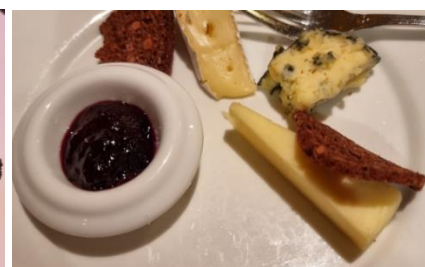
Lokale oster m solbær