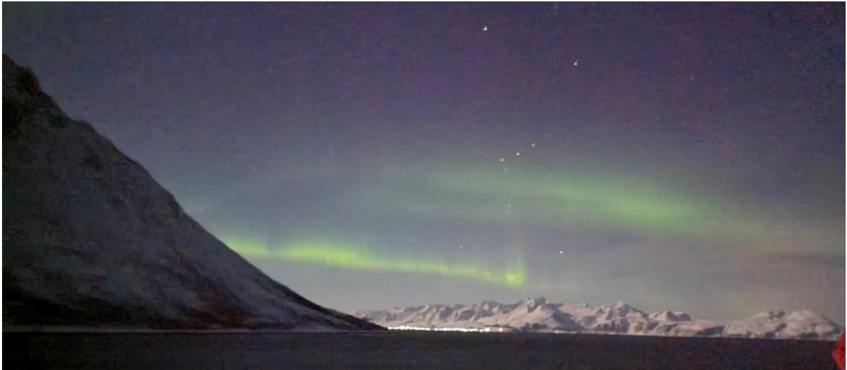
Nordlyset, og vi øyner stjernebildet Orion midt i bildet

Hurtigruta er innom 33 havner på vei nordover og 32 på vei sørover. De fleste stoppene er korte, 15-20 minutter. I Ålesund har en hele dagen, i Trondheim tid til Nidarosdomen eller tur i kayak. I Bodø kan en besøke Saltstraumen eller gå på Kunstutstilling. Og sånn går det fra sted til sted. I Honningsvåg