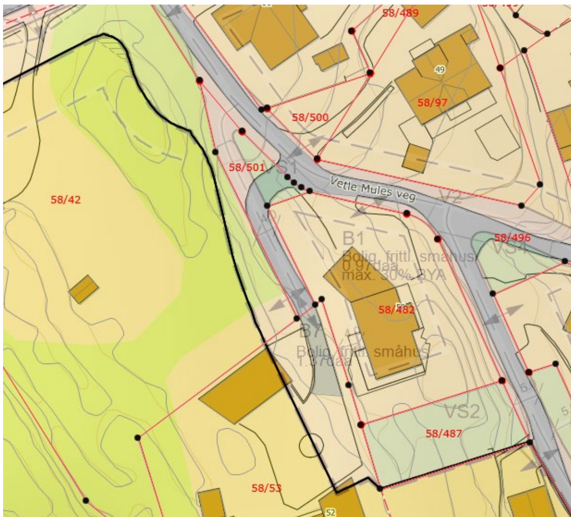
Figur 2 - Illustrasjon som viser både gjeldende regulering og dagens situasjon. Del av etablert veg til/fra gbnr. 58/53 avviker fra den regulerte vegløsningen.

I forbindelse med utarbeidelse av gjeldende reguleringsplan for Vetle Mules veg (2014), ble det besluttet å stenge vestre kryss med Nystrandvegen, slik at biltrafikk i Vetle Mules veg ble ledet via det østre krysset med Nystrandvegen, der veg-geometri og siktforhold er forskriftsmessige. Regulert avgrensning av Vetle Mules veg ble opprettholdt langs/inntil den etablerte, smale vegen. Det endrete kjøremønsteret utløste behov for utvidet svingradius i avkjørsel/forgrening til Vetle Mules veg 52 (gbnr. 58/53), siden den etablerte vegløsningen var basert på inn-/utkjøring mot det vestre (og nå stengte) krysset med Nystrandvegen. Dette forholdet ble ikke fanget opp ifm. utformingen av den gjeldende reguleringsplanen. Den aktuelle avkjørselen er i dag opparbeidet/tilpasset med veg-geometri som gir nødvendig fremkommelighet for personbil, jf. figur 2. Foreslått planendring vil gi et samsvar mellom reguleringsplan og situasjonen på stedet.