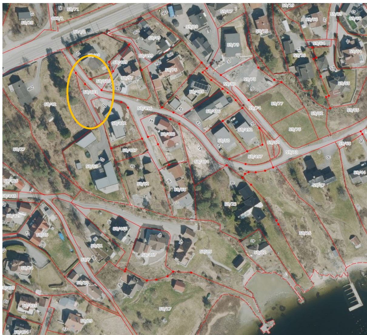
Figur 1 - Orange oval viser området som omfattes av endringen (gbnr. 58/501).