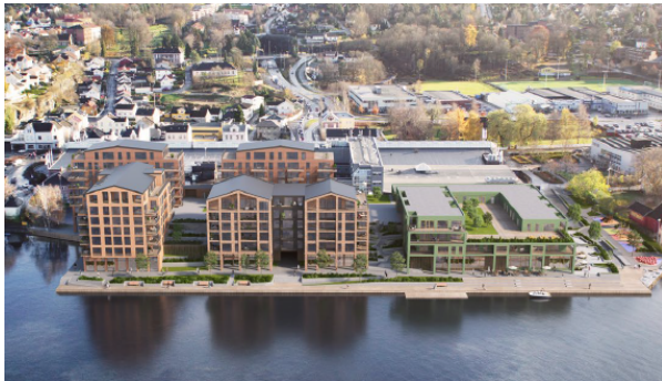
Illustrasjon som medfølger foreslått reguleringsendring

Gjeldende plan legger opp til utbygging av Down Town som krever ombygging av eksisterende bygningsmasse med rampe til tak, takparkering og boliger over eksisterende senter. Etter renoveringen av Down Town er dette ikke lenger aktuelt. Det foreslås å justere enkelte feltgrenser og byggehøyder slik at en utbygging som illustrert under til venstre kan gjennomføres. Det innebærer at den planlagte utbyggingen i hovedsak skjer over eksisterende parkeringsareal. Nytt hovedgrep legger til rette for å bryte opp bygningsvolumet mot Porsgrunnselva, i tillegg til at det åpnes for saltak, med hensikten å oppnå god tilpasning til eksisterende omkringliggende omgivelser.