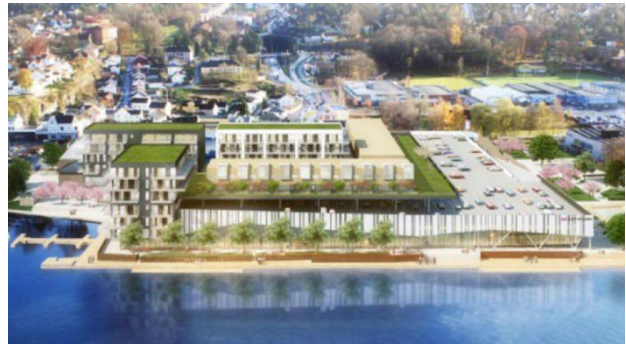
Illustrasjon fra gjeldende reguleringsplan