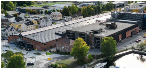
Foreslått løsning med tak over dagens takparkering

I forbindelse med utbyggingen mot elva, foreslås det at dagens takparkering kan overbygges med tak. Dagens fasade på parkeringshuset er tenkt oppgradert i forbindelse med tiltaket.