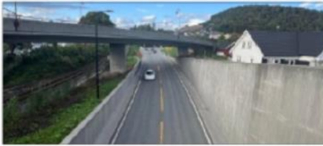
MINDRE: Støyen fra fylkesveiene ønskes redusert.