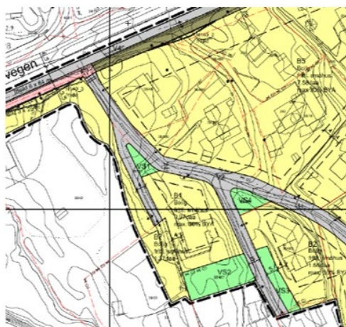
Utsnitt av gjeldende reguleringsplan

Stengingen av avkjørselen fra Nystrandvegen skapte et behov for en utvidet svingradius ved avkjørselen, da kjøremønsteret for eiendommen gbnr. 58/53 ble endret. Dette ble ikke oppdaget ved utforming av gjeldende reguleringsplan. Det ønskes derfor en planendring som vil gi samsvar mellom reguleringsplanen og den etablerte løsningen på stedet.